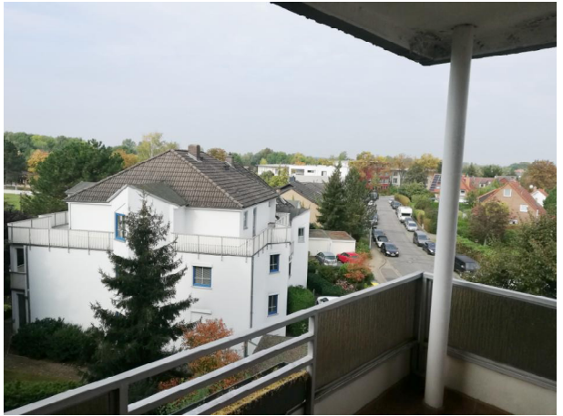
Blick vom Balkon 2