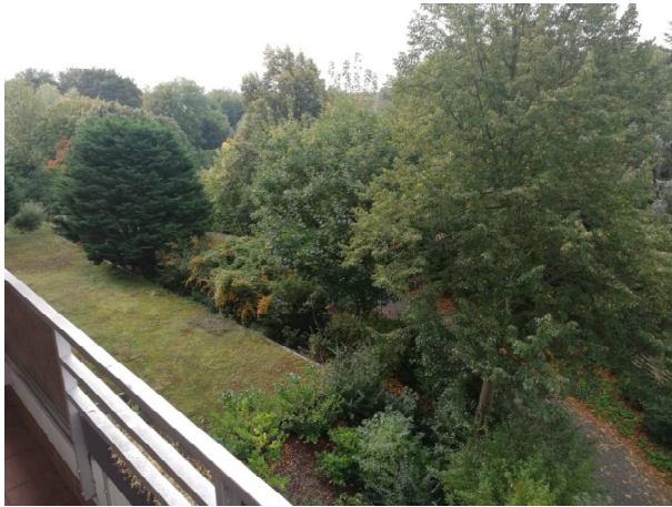
Blick vom Balkon 1